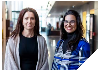
L'équipe internationale au grand complet avec le pôle stéphanois (ci-contre) et le binôme du Campus Aix-Marseille-Provence (ci-dessus).