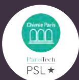
CHIMIE ParisTech PSL