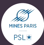
MINES Paris PSL