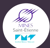
MINES St Étienne