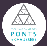
Ecole Nationale des Ponts et Chaussées

Le concours commun Mines-Ponts est ouvert pour l'admission des élèves-ingénieurs dans les 10 grandes écoles suivantes :