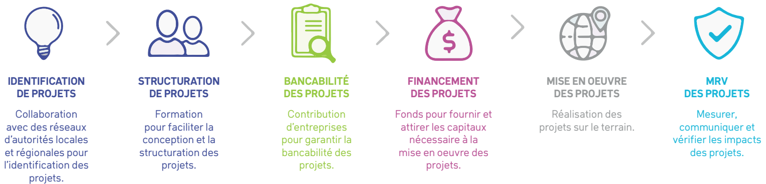
Figure 1: la chaîne de valeur R20 des projets pour le climat

C'est précisément là tout l'intérêt de la Chaire Infrastructures et territoires durables initiée par MINES Saint-Étienne et la Fondation R20, puisqu'elle va permettre, à travers la formation, le renforcement de capacité et l'accès aux connaissances, d'appuyer les porteurs de projets africains dans la phase de structuration de leur projet, en les formant et les accompagnant par des professionnels experts, y compris ceux d'EGIS / CDC avec qui le R20 a un accord de partenariat, pour aboutir à des projets bancables.