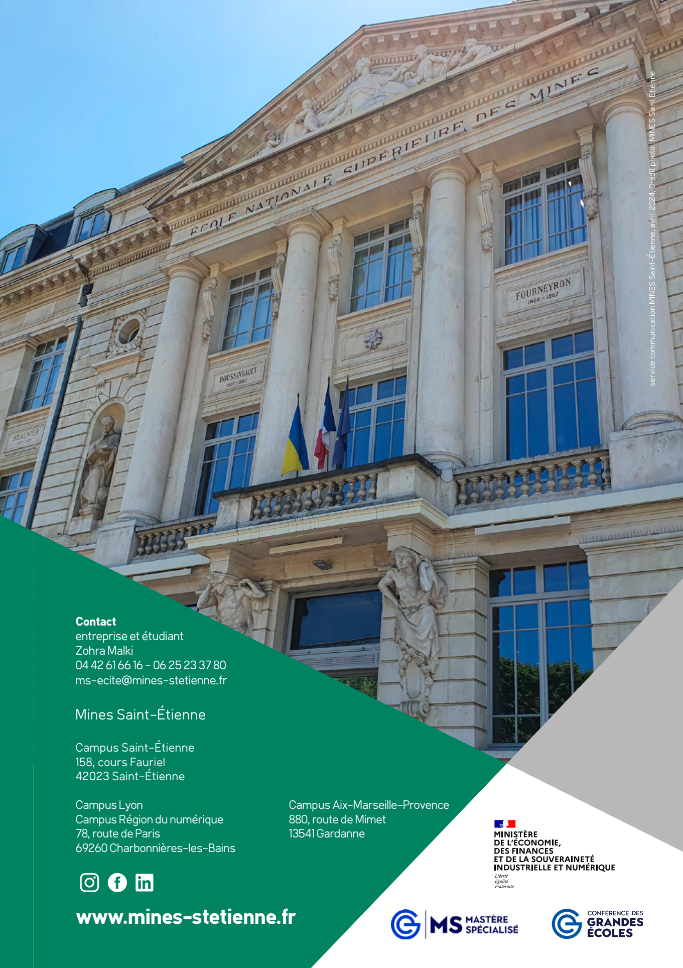
service communication MINES Saint-Étienne, avril 2024, crédit photo : MINES Saint-Étienne